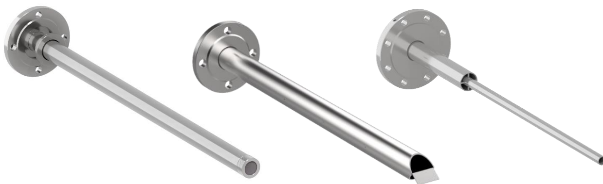
Рисунок 4 – Общий вид зондов газоанализаторов стационарных ЭРИС Оксициркон