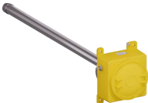
Рисунок 1 – Общий вид измерительного блока газоанализаторов стационарных ЭРИС Оксидиркон 1

Пломбирование корпуса газоанализаторов от несанкционированного доступа не предусмотрено.