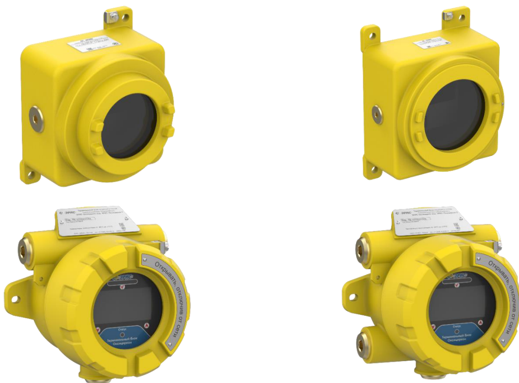
Рисунок 3 – Общий вид терминальных блоков газоанализаторов стационарных ЭРИС Оксициркон