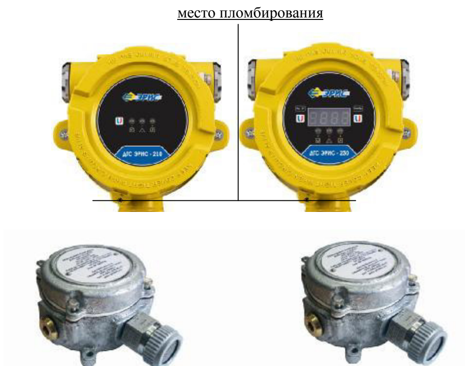
Рисунок 4 – Внешний вид датчика-газоанализатора ДГС ЭРИС-210, ДГС ЭРИС-230 модификаций ДГС ЭРИС-210ИК, ДГС ЭРИС-210ТК, ДГС ЭРИС-210ЭЛ, ДГС ЭРИС-230ИК, ДГС ЭРИС 230-ТК, ДГС ЭРИС-230ЭЛ с выносным термокаталитическим сенсором НТ