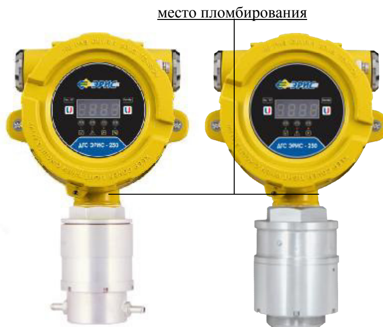
Рисунок 2 – Внешний вид ДГС ЭРИС-230ИК, ДГС ЭРИС-230ТК, ДГС ЭРИС-230ЭЛ