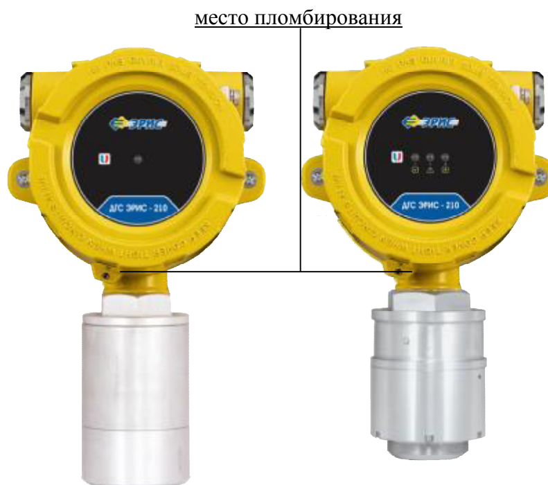
Рисунок 1 – Внешний вид ДГС ЭРИС-210ИК, ДГС ЭРИС-210ТК, ДГС ЭРИС-210ЭЛ

Общий вид датчиков-газоанализаторов ДГС представлен на рисунках 1-5.