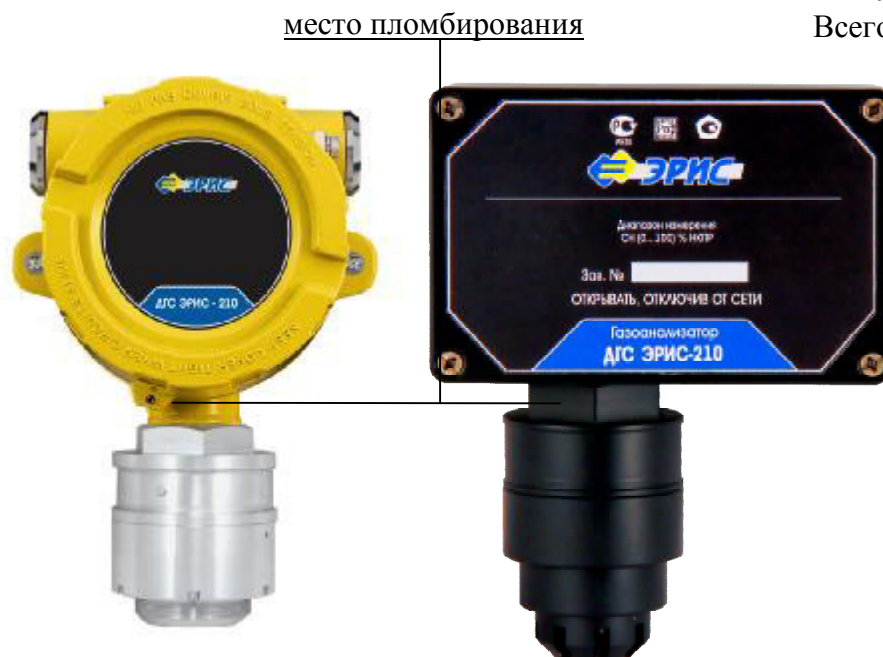
Рисунок 3 – Внешний вид ДГС ЭРИС-210ИК, ДГС ЭРИС-210ТК, ДГС ЭРИС-210ЭЛ без индикации