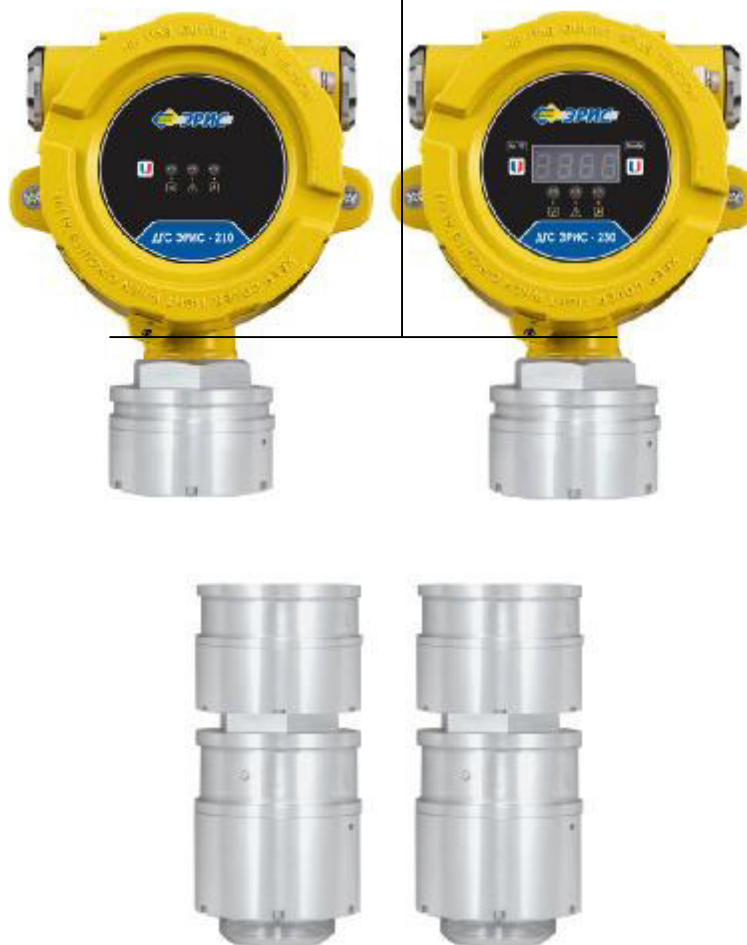
Рисунок 5 – Внешний вид датчика-газоанализатора ДГС ЭРИС-210, ДГС ЭРИС-230 модификаций ДГС ЭРИС-210ИК, ДГС ЭРИС-210ТК, ДГС ЭРИС-210ЭЛ, ДГС ЭРИС-230ИК, ДГС ЭРИС-230ТК, ДГС ЭРИС-230ЭЛ с выносным оптическим сенсором НТ