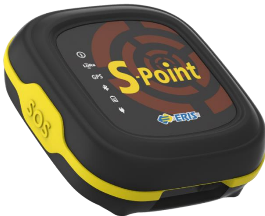
Рисунок 1 – Внешний вид устройства в сборе

Внешний вид устройства в сборе приведен на рисунке 1.