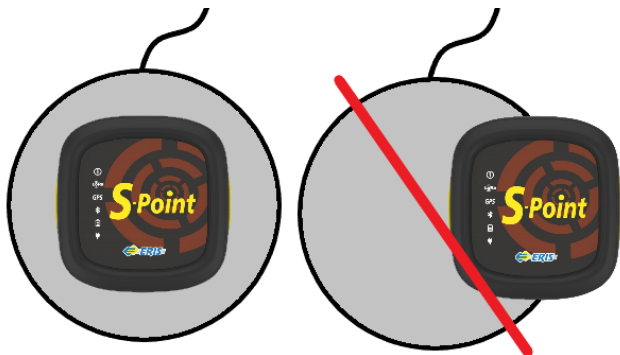
Рисунок 3 – Положение устройства при зарядке