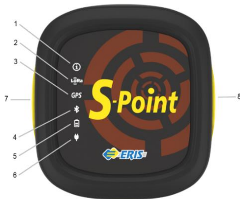
Рисунок 2 – Внешний вид передней панели устройства

Внешний вид передней панели устройства приведен на рисунке 2. Основные элементы устройства приведены в таблице 2.