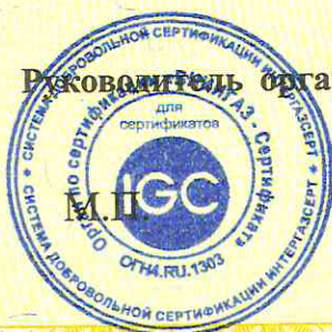
Схема сертификации 2d.